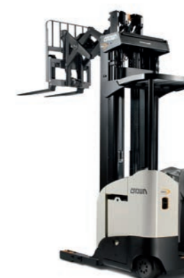
RD 5725 Dubbeldiepe reachtruck

Hefvermogen: 1600 en 2000 kg Hefhoogte: 5025 tot 11225 mm