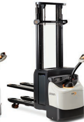
ESi 4000 Serie Palletstapelaar met initiaalheffing

Hefvermogen: 1200, 1400 en 1600 kg Hefhoogte: 2440 tot 5400 mm