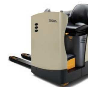
RT 4000 Serie Meerijpallettruck Hefvermogen: 2000 kg