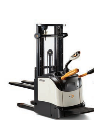
ET 4000 Serie Stapelaar met platform

Hefvermogen: 1200, 1400 en 1600 kg Hefhoogte: 2440 tot 5400 mm