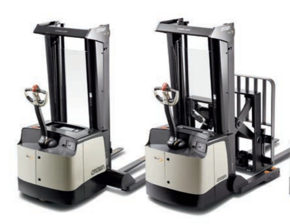
SH 5500 Serie Straddle Stacker

Hefvermogen: 2000 kg Hefhoogte: 1700 tot 2600 mm