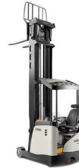
ESR 5280S S-klasse reachtruck

Hefvermogen: 1400, 1600 en 2000 kg Hefhoogte: 2760 tot 13560 mm