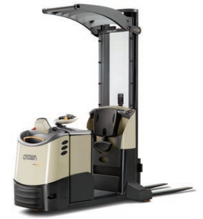
MPC 3000 Serie Orderpicker met hefmast Leverbaar met QuickPick® Remote-technologie Hefvermogen: 1200 kg Hefhoogte: 800 tot 4300 mm