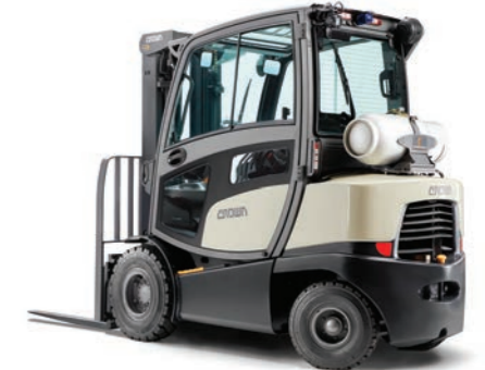
C-5 Serie LPG-vierwieltruck met contragewicht en volledige cabine Hefvermogen: 2000, 2500 en 3000 kg Hefhoogte: 2665 tot 7465 mm