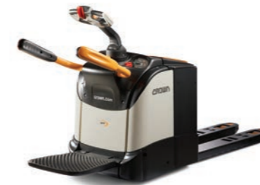
WT 3000 Serie Elektrische pallettruck met uitklapbaar platform Hefvermogen: 2000 en 2500 kg