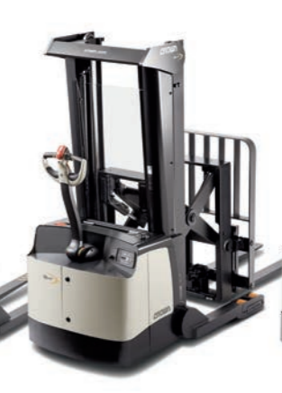
SHR 5500 Serie Breedspoorstapelaar

Hefvermogen: 1800 kg Hefhoogte: 3225 tot 4875 mm