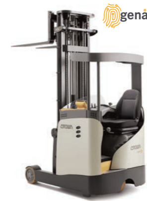
ESR 1040 Reachtruck

Hefvermogen: 1400 en 1600 kg Hefhoogte: 2760 tot 9450 mm