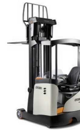
ESR 5240/60 Reachtruck

Hefvermogen: 1400 en 1600 kg Hefhoogte: 2760 tot 9090 mm