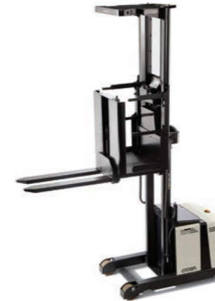
LP 3500 Serie Middenheffende orderpicker Hefvermogen: 1000 kg Hefhoogte: 1025 tot 2440 mm