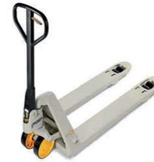
PTH 50 Serie Handpallettruck

De TC-serie kan ook worden gecombineerd met de QuickPick® Remote technologie, wat tot indrukwekkende procesverbeteringen leidt.