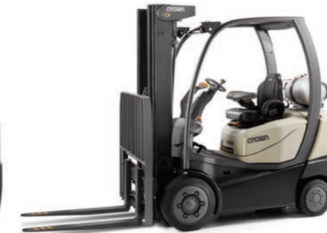
C-5 Serie LPG-vierwieltruck met contragewicht en luchtbanden Hefvermogen: 2000, 2500 en 3000 kg Hefhoogte: 2665 tot 7465 mm