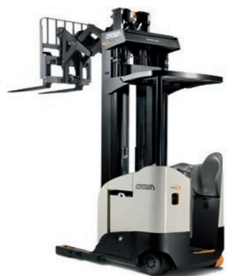
RD 5795S S-klasse dubbeldiepe reachtruck

Hefvermogen: 1450 kg Hefhoogte: 5025 tot 10160 mm