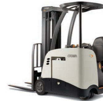
RC 5500 Serie Driewieltruck met contragewicht en staanplaats Hefvermogen: 1500 en 1800 kg Hefhoogte: 3910 tot 7010 mm