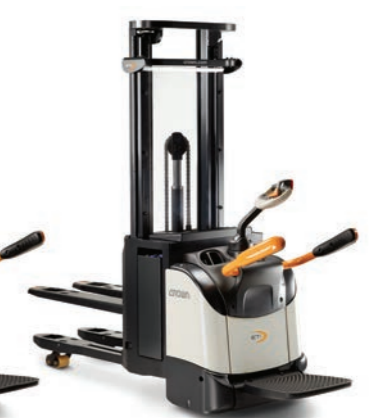
ETi 4000 Serie Palletstapelaar met initiaalheffing

Hefvermogen: 1200, 1400 en 1600 kg Hefhoogte: 2440 tot 5400 mm