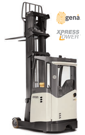
ESR 1060 Vrieshuiscabine

Hefvermogen: 1600 en 2000 kg Hefhoogte: 4440 tot 13560 mm