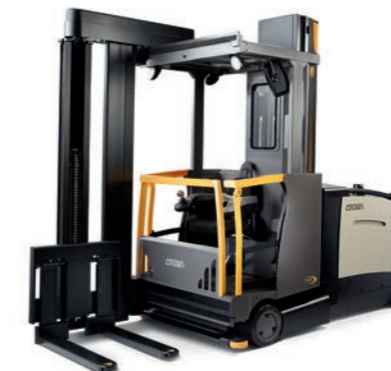
TSP 7000 Serie Hoogstapeltruck Hefvermogen: 1000, 1250 en 1500 kg Hefhoogte: 4900 tot 17145 mm