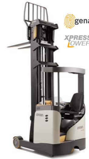
ESR 1060 Reachtruck met Xpress Lower™ technologie

Hefvermogen: 1600 en 2000 kg Hefhoogte: 4440 tot 13560 mm