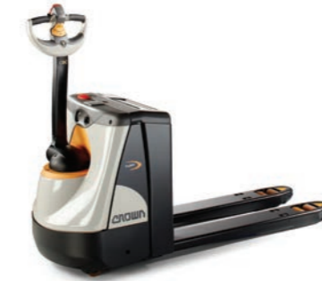
WP 3000 Serie Elektrische pallettruck