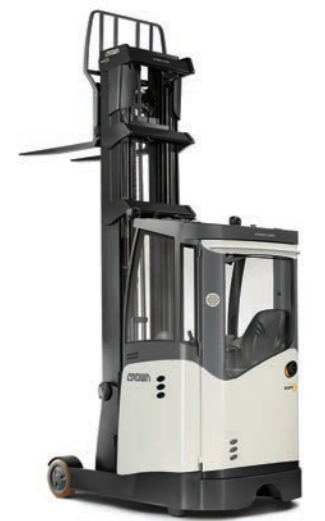
ESR 5260 Vrieshuiscabine

Hefvermogen: 1600 en 2000 kg LHefhoogte: 4440 tot 13560 mm