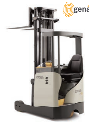
ESR 1020 Reachtruck met smal chassis

De RR Serie reachtruck met pantograaf heeft een bestuurderscompartiment met een variabele zijwaartse werkhouding, waardoor de bestuurder meer bewegingsvrijheid heeft voor een ontspannen werkhouding en hogere productiviteit. De S-klasse modellen hebben een groter bestuurderscompartiment met neerklapbare stoel, zodat de bestuurder kan zitten, leunen of staan. Dit betekent meer comfort en hogere productiviteit in de snelle werkomgeving van smalle gangen. De RD Serie met dubbel reachbereik zorgt voor aanzienlijk meer opslagmogelijkheden in stellingen zonder uitbreiding van de faciliteiten.