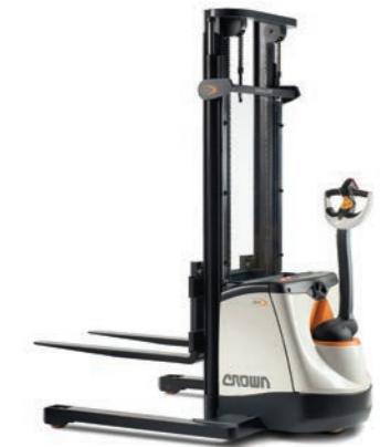
SX 3000 Serie Breedspoorstapelaar Hefvermogen: 1350 kg Hefhoogte: 2400 tot 4250 mm