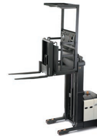
SP 3500 Serie 3-punts orderpicker Hefvermogen: 1000 en 1250 kg Hefhoogte: 4215 tot 9600 mm