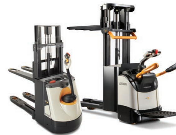
DS 3000 Serie Dubbele stapelaar

Hefvermogen: 1200, 1400 en 1600 kg Hefhoogte: 2440 tot 5400 mm