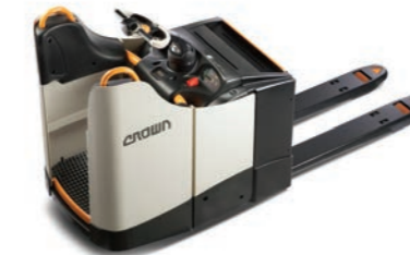
WT 3000 Serie Elektrische pallettruck met vast platform Hefvermogen: 2000 en 2500 kg