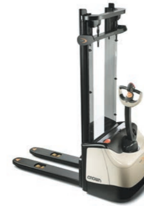
WF 3000 Serie Palletstapelaar Hefvermogen: 1000 en 1200 kg Hefhoogte: 1550 tot 4400 mm