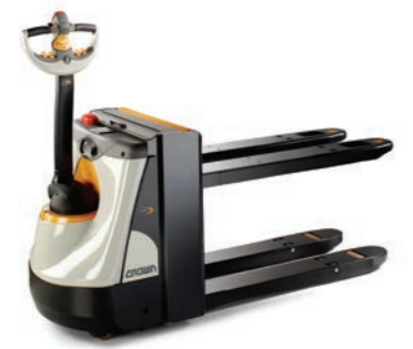
WP 3000 Serie Elektrische pallettruck met hoge heffing van lasten tot 750 mm Hefvermogen: 800 en 2000 kg