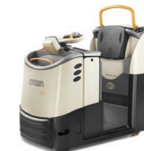
TC 3000 Serie Trekker Leverbaar met QuickPick® Remote-technologie Hefvermogen: 3000 kg