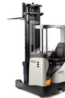
ESR 5220 Reachtruck met smal chassis

Hefvermogen: 1400, 1600 en 2000 kg Hefhoogte: 4440 tot 13560 mm