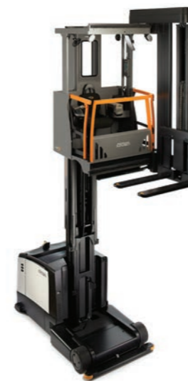
TSP 6500 Serie Hoogstapeltruck Hefvermogen: 1000, 1250 en 1500 kg Hefhoogte: 4900 tot 13485 mm