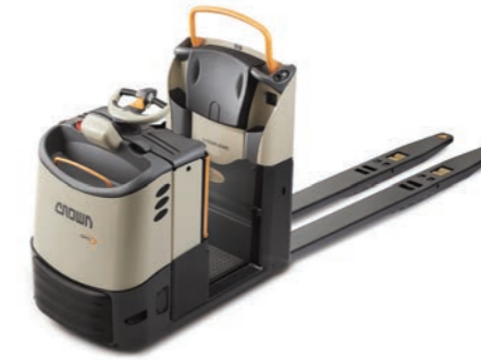
GPC 3000 Serie Laagheffende orderpicker Leverbaar met QuickPick® Remote-technologie Hefvermogen: 2000, 2500 en 2700 kg