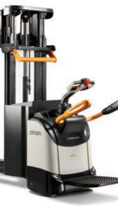
DT 3000 Serie Dubbele stapelaar

Hefvermogen: 2000 kg Hefhoogte: 1700 tot 2600 mm