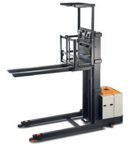
SP 3500 Serie 4-punts orderpicker Hefvermogen: 625 en 1250 kg Hefhoogte: 5335 tot 9295 mm