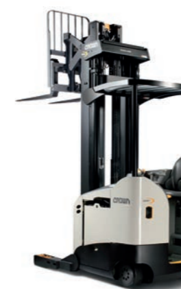
RR 5795S S-klasse reachtruck

Hefvermogen: 1600 en 2000 kg Hefhoogte: 5025 tot 10160 mm