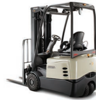
SCT 6000 Serie Driewieltruck met contragewicht Hefvermogen: 1300, 1600, 1800 en 2000 kg Hefhoogte: 2895 tot 7490 mm

De LPG-vierwieltruck van de C-5-serie is ontworpen om lang mee te gaan in veeleisende en intensief gebruikte omgevingen. De C-5 verhoogt de productiviteit dankzij componenten die aan de vereisten van zware industriële toepassingen voldoen en is leverbaar met een gedeeltelijke of een volledige cabine.