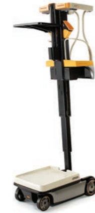
WAV 60 Serie Work Assist Vehicle Draagvermogen: laadplateau 90 kg laadvloer 115 kg Hefhoogte: 2995 mm

Crown ontwerpt en produceert zijn smallegangstrucks van de TSP-serie voor het transport van volle pallets of een combinatie van het verzamelen van colli en pallettransport.