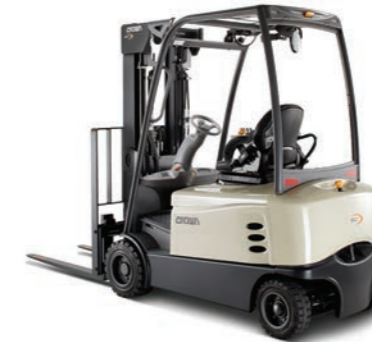
SCF 6000 Serie Vierwieltruck met contragewicht Hefvermogen: 1600, 1800 en 2000 kg Hefhoogte: 2895 tot 8075 mm