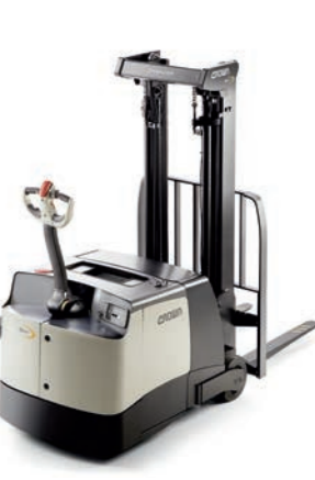
SHC 5500 Serie Reachstapelaar met contragewicht

Hefvermogen: 1100, 1350 en 1600 kg Hefhoogte: 3225 tot 4875 mm