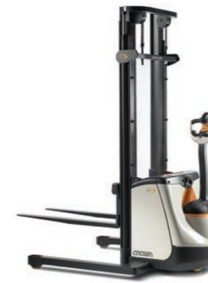
ST 3000 Serie Breedspoorstapelaar Hefvermogen: 1000 kg Hefhoogte: 2400 tot 4250 mm