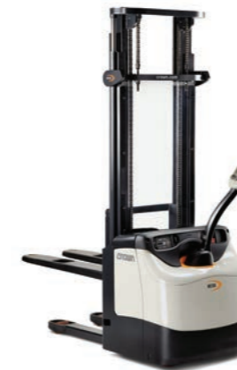
ES 4000 Serie Stapelaar