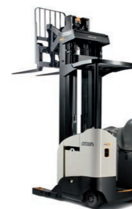
RR 5725 Reachtruck met pantograaf

Hefvermogen: 1400, 1600 en 2000 kg Hefhoogte: 4440 tot 13560 mm