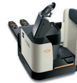
PR 4500 Serie Meerijpallettruck Hefvermogen: 3000 kg