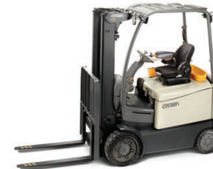
FC 5200 Serie Vierwieltruck met contragewicht Hefvermogen: 2000, 2500 en 3000 kg Hefhoogte: 2895 tot 7925 mm