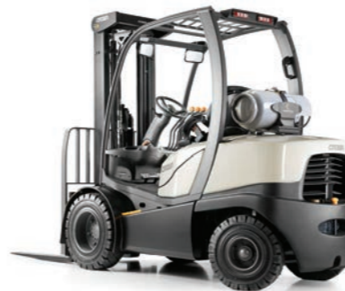
C-5 Serie LPG-vierwieltruck met contragewicht en superelastische banden Hefvermogen: 2000, 2500 en 3000 kg Hefhoogte: 2665 tot 7465 mm